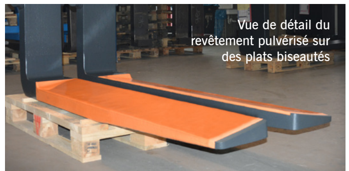
Vue de détail du revêtement pulvérisé sur des plats biseautés