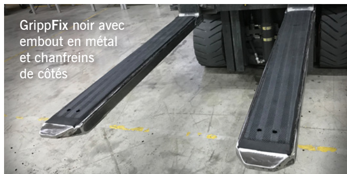
GrippFix noir avec embout en métal et chanfreins de côtés